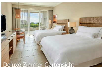
Deluxe Zimmer Gartensicht

Zimmer: 445 Deluxe Zimmer und Suiten, davon 131 mit privaten Infinity- Pools. Die Zimmer sind ausgestattet mit separater Ba- dewanne und Dusch- kabine, Fön, Bademän- tel, Hausschuhe, Telefon, TV, WiFi kostenlos, Safe und 24h-Zimmerservice.