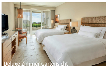
Deluxe Zimmer Gartensicht

Sport/Wellness: Anazoe Thalassotherapy Spa, Massagebehandlungen, Whirlpools, Sauna, Innenpool, Fitnessraum, Fahrrad- und Bootsverleih, Wassersport, Tauchunterricht.