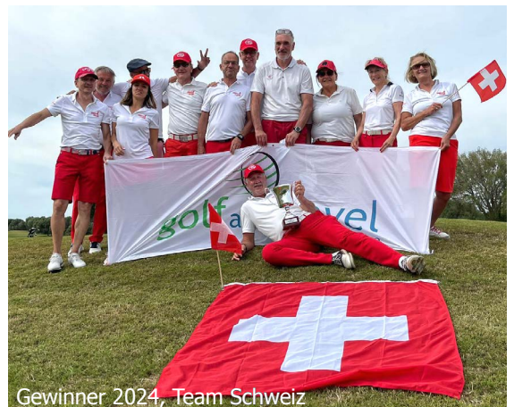
Gewinner 2024, Team Schweiz