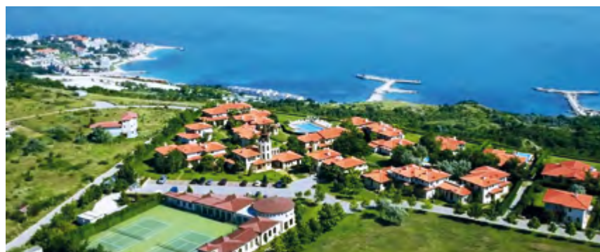
Thracian Cliffs Golf