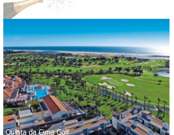
Quinta da Cima Golf

WICHTIG: Limitierte Anzahl Flugplätze zu oben stehenden Konditionen. Ist die berechnete Buchungskategorie nicht mehr verfügbar, behalten wir uns vor, den Flugzuschlag aufzurechnen. Früh buchen lohnt sich! 1tb500