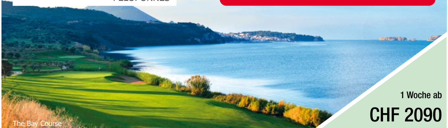
The Bay Course