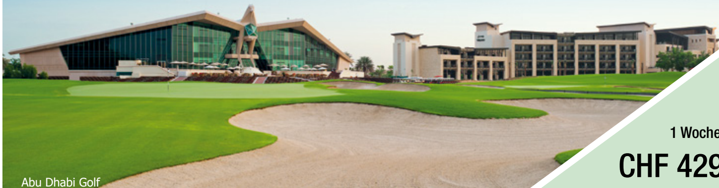
Abu Dhabi Golf

NEUJAHRSGOLFWOCHEN 27. DEZ 2022 – 03. JAN 2023