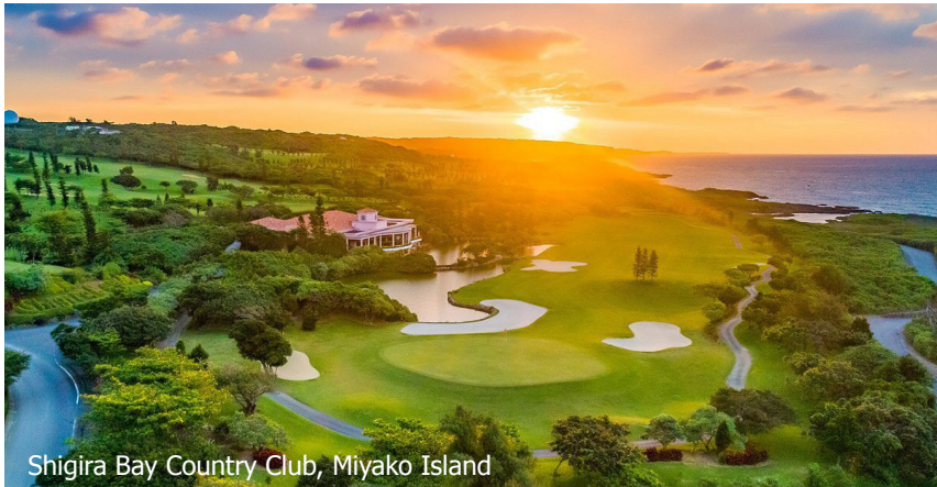
Shigira Bay Country Club, Miyako Island

tion an. Lassen Sie sich verzaubern von einem Land wo alles anders ist. Die Einzelheiten der Reise und Hotels sind in Ausarbeitung. Für weitere Informationen rufen Sie uns an. Wir werden Sie gerne über diese einzigartige Rundreise beraten.