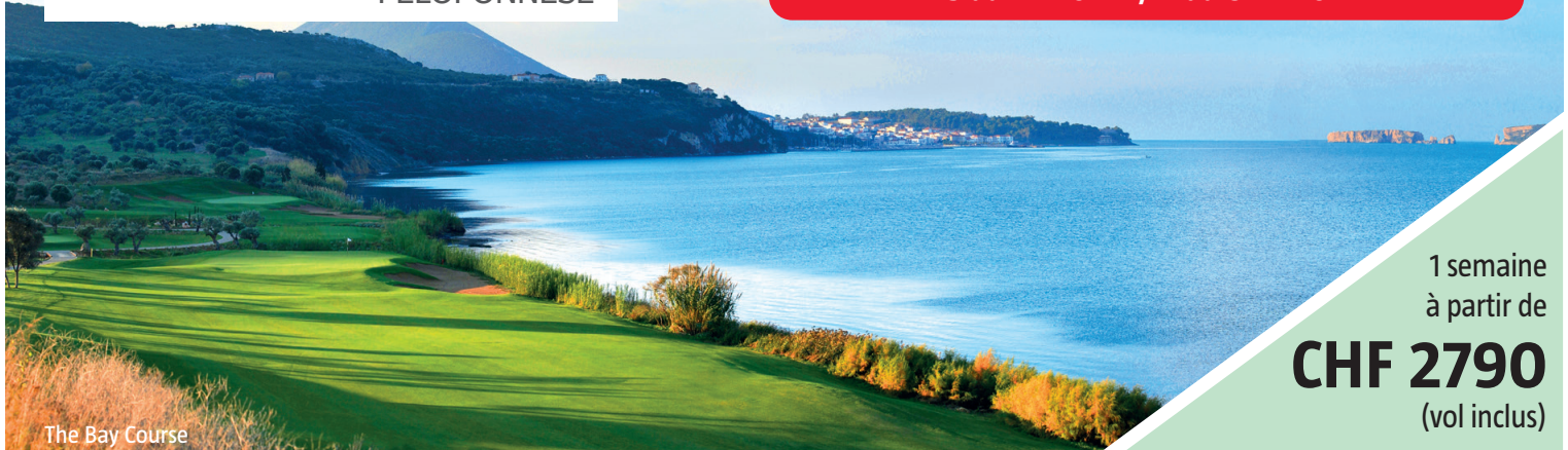
The Bay Course