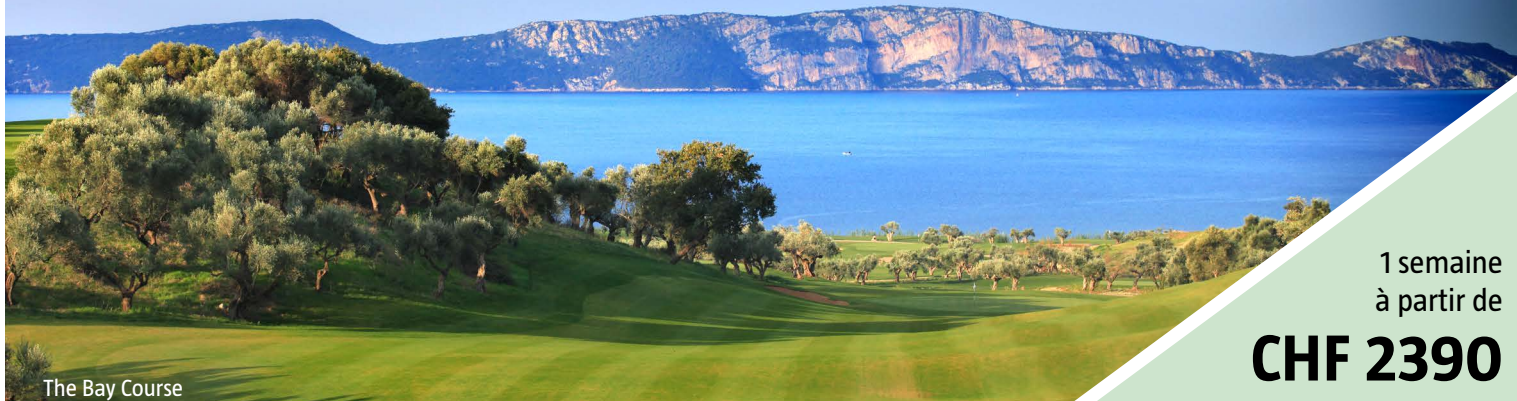
The Bay Course